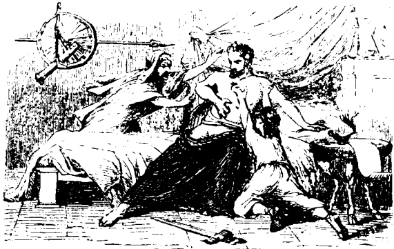
CATON D'UTIQUE DÉCHIRANT SES ENTRAILLES

PARIS FERDINAND SARTORIUS, ÉDITEUR 9, RUE MAZARINE, 9