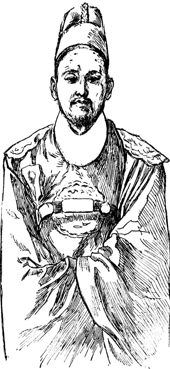
LE ROI DE CORÉE.