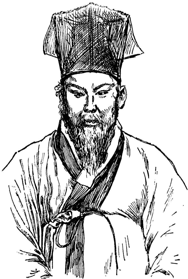
LE GRAND-PÈRE DU ROI DE CORÉE.