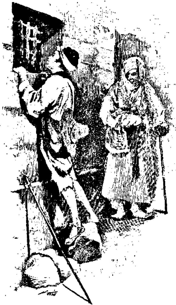
... I-Toreng parut à la fenêtre...