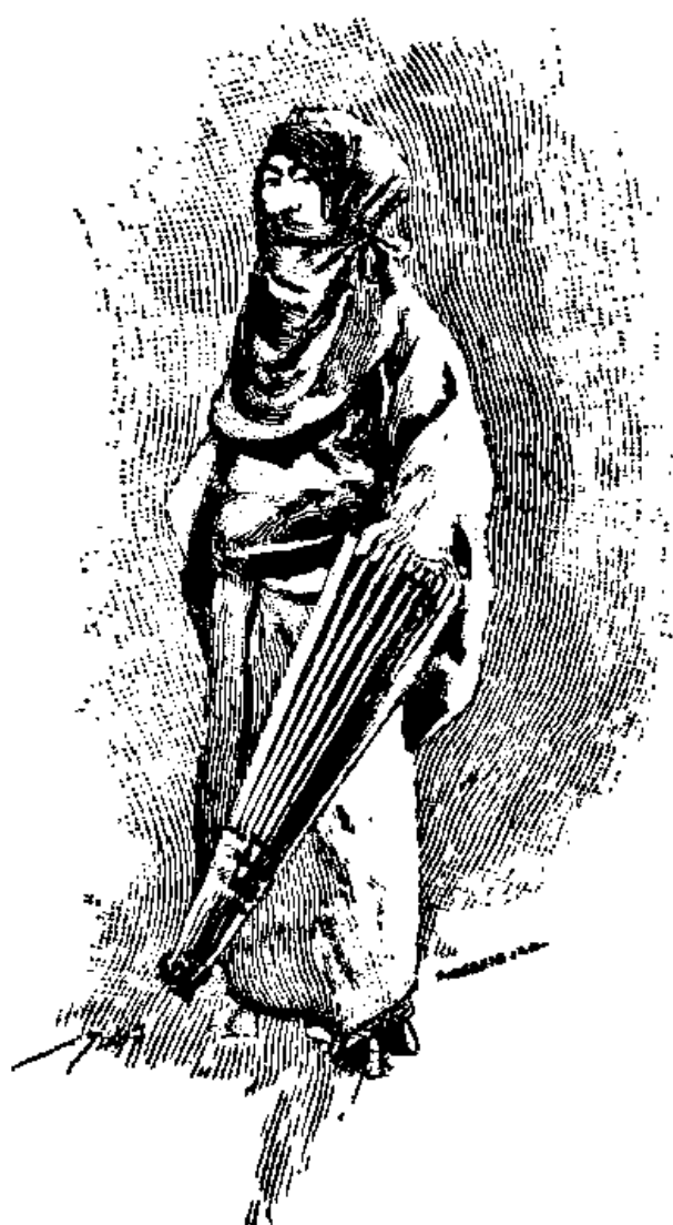
... I-Toreng se déguisa en femme...