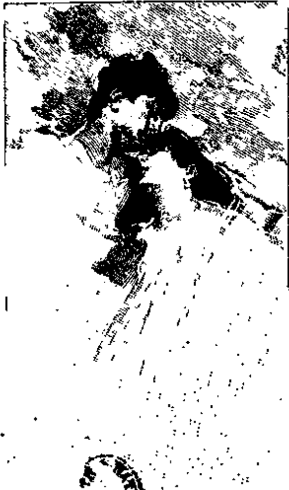
figure et le baisa, disant qu'elle l'aimait bien, qu'elle était ravie de lui :

« Mais soyez raisonnable, ne venez pas si souvent les autres jours, travaillez, je vous en prie. »